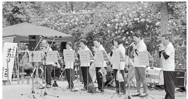
▲昨年の「バラの小径祭り」での舞台発表の様子