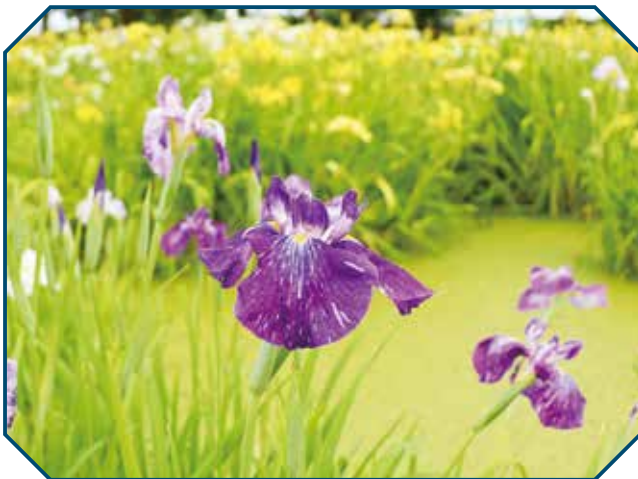
▲町民カメラマン染谷勝文さん撮影