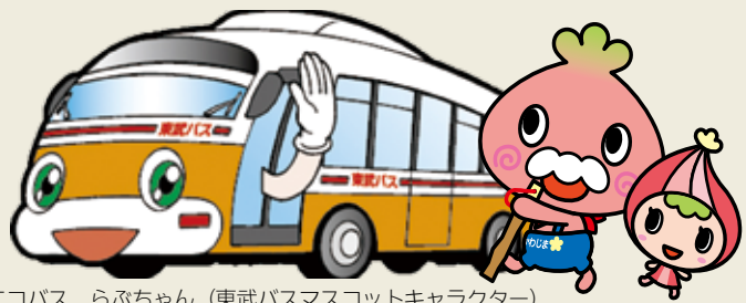
エコバス らぶちゃん（東武バスマスコットキャラクター）