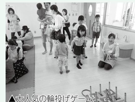
▲大人気の輪投げゲーム

5月5日(祝・土)、6日(日)に「こどもの日イベント」を開催しました。子どもたちは、こいのぼりが飾られた保育室の中でお菓子釣りや輪投げ、紙粘土のケーキマグネット作りなどを楽しみました。