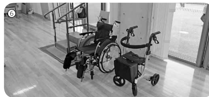
①社会福祉功労者表彰・まごころ福祉表彰 ②平成の森公園多目的広場の巨大三角テント ③役場前広場の各種模擬店 ④川島中学校・西中学校吹奏楽部の発表 ⑤ワーク&ライクのびっこの模擬店 ⑥福祉器具の展示

5月4日(祝・金)、5日(祝・土)、町民体育館でちびっこダンボール迷路を開催しました。たくさんのお子たちがダンボールの迷路のなかで、はしゃぎながらゴールを目指していました。また、体育館ではフロアカーリングの体験も実施しており、子どもたちは真剣にルールを聞き、競技を楽しんでいました。