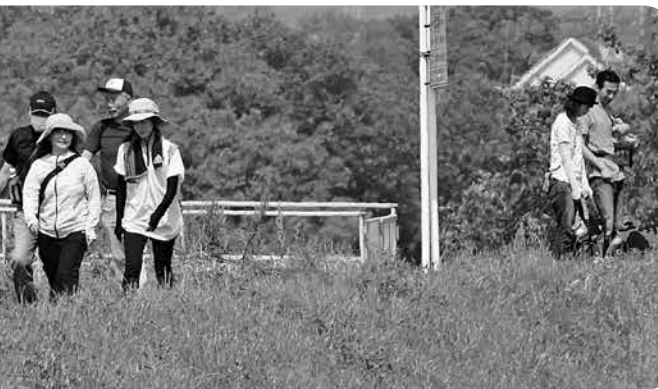
①スタートの合図 ②目指せ完歩(町民カメラマン宇津木義雄さん撮影) ③第3チェックポイントに来たよ ④出発の様子(町民カメラマン馬橋和雄さん撮影) ⑤出発式直後の様子(町民カメラマン馬橋和雄さん撮影) ⑥トマトおいしい！ ⑦上伊草のウォーキングの様子(町民カメラマン宇津木義雄さん撮影)