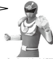
ごみすっきり応援団 かわじマンレッド

「平成29年度のごみ減量化は前年度と比べて5.7%減ったんだ。ただ、町が計画した減量化の目標には届かなかったんだ。」