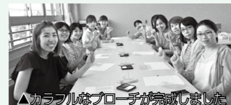
△カラフルなブローチが完成しました

5月18日(金)、かわみんハウスでママのリフレッシュタイムを行いました。当日は、スタッフがお子さんを託児し、保護者の皆さんはプラスチック板を使用したブローチづくりに挑戦しました。参加した皆さんは、少しの時間ですが、育児から離れ、ゆっくりとした時間を過ごすことができました。