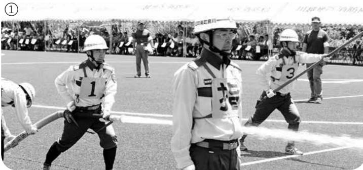
①1位となった第5分団 ②放水始め!

この審査会で町の消防団は全て「秀級」の認定を受け、第5分団(ハツ保)は1位となりました。1位となった第5分団は、8月4日(土)の埼玉県消防操法大会に出場します。