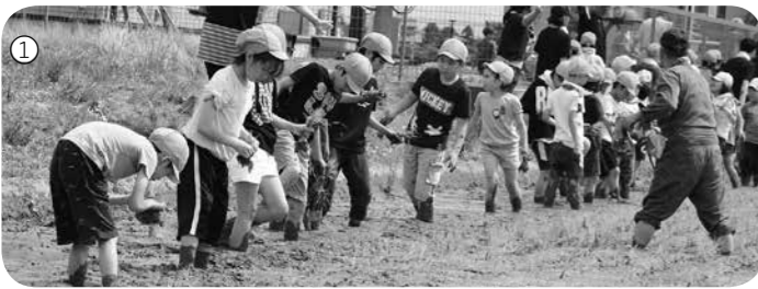
①②上手に植えられるかな

6月5日(火)、つばさ南小学校の全児童138人が、三保谷公民館隣の田んぼで田植え体験を行いました。児童たちは泥にまみれて、楽しみながら田植えを行っていました。