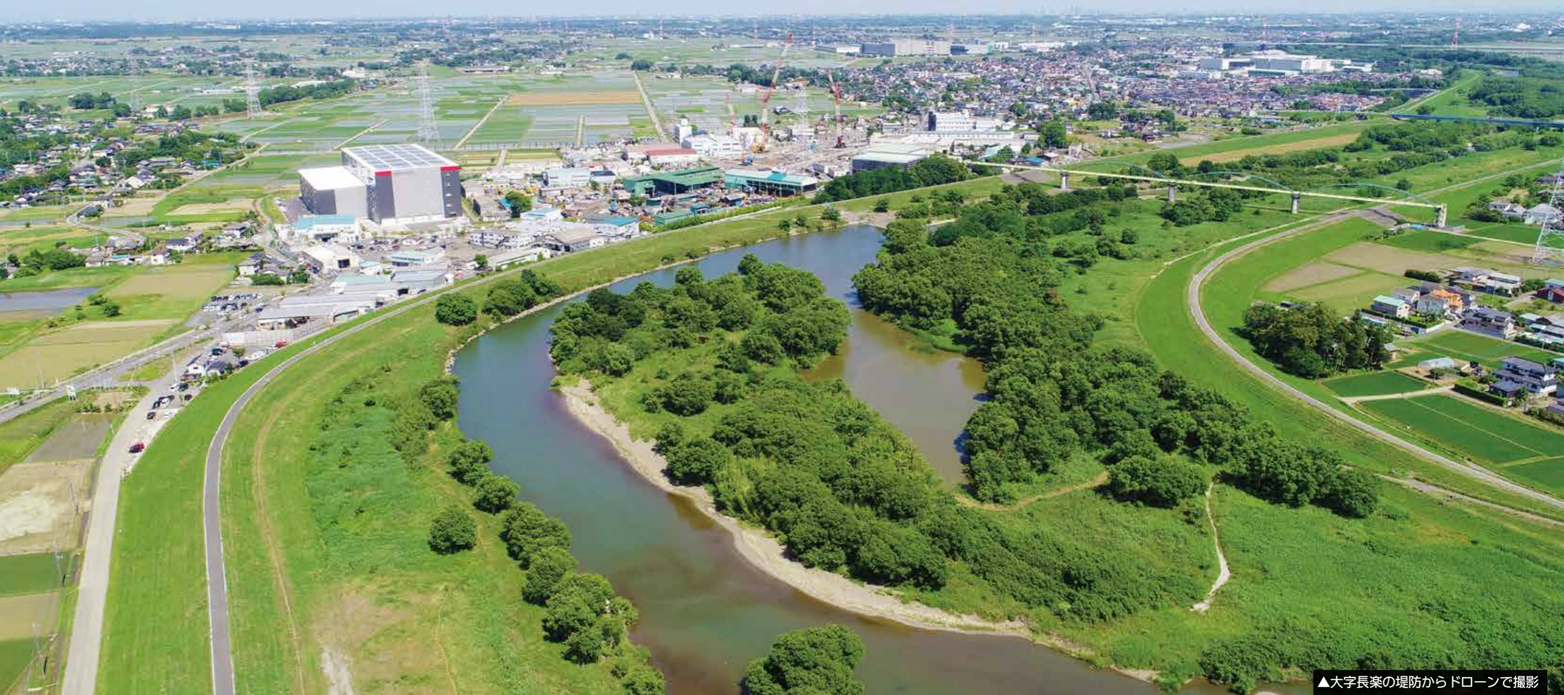
▲大字長楽の堤防からドローンで撮影