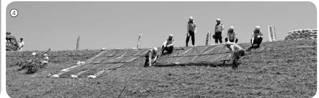
①防災航空隊ヘリによる救出救助 ②水防団出動 ③五徳縫い ④表シート張り