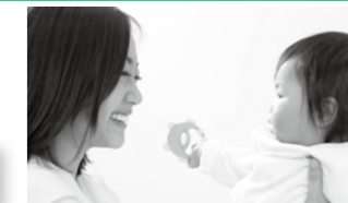
かわみんハウス公式HP