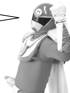
ごみすっきり応援団 かわじマンレッド

そうだね、いなほくん。そこで夏休みの自由課題として、町内の小中学生を対象に、ポスターや標語を募集するよ。