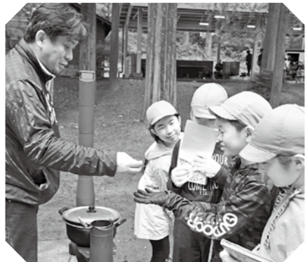
▲これは広葉樹のもの？(小川げんきプラザ)

年輪は1年に一つずつ増え、年輪を数えると樹齢が分かること、また季節の違いがはっきりとしている日本だからこそ、年輪が見られることなどを学びました。子どもたちは年輪はどこから増えていくのかをクイズ形式で楽しく学びました。