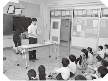
▲事前学習で年輪について学ぶ児童

町では、平成 28 年度の「川島町学校木育推進宣言」を契機として、子どもたちが木材を利用することの良さや利用方法を体験的に学び、環境改善などへの関心を高めるため、各小学校で木育を推進しています。