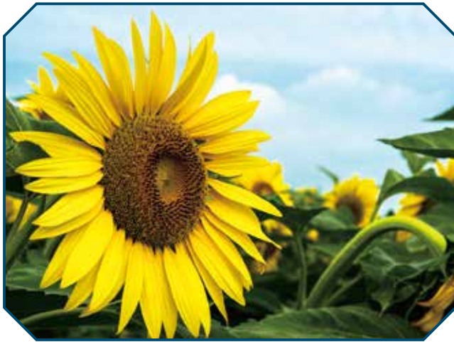
▲町民カメラマン清水芳明さん撮影