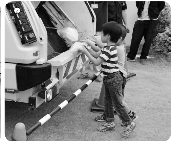
①これは何ごみかな ②ごみ収集車がごみを食べてくれるよ