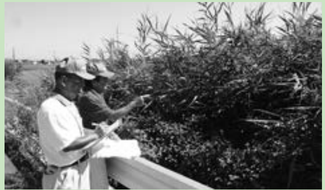
農業委員による調査の様子