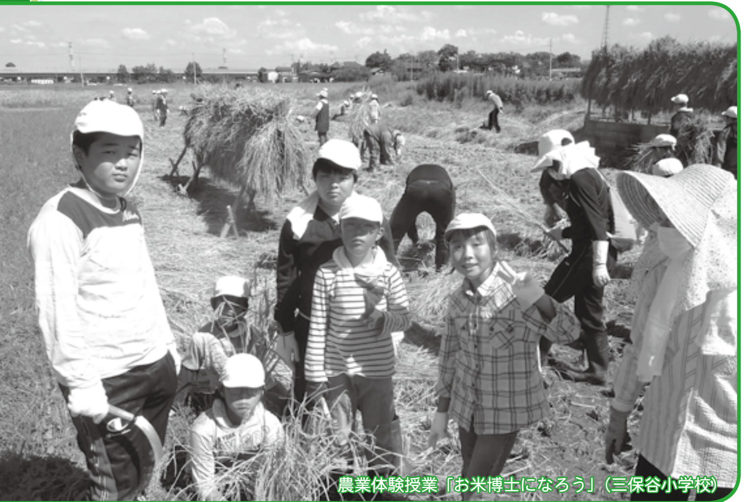
農業体験授業「お米博士になろう」(三保谷小学校)