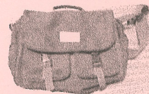
約 25cm × 40cm

リユースも受け付けています。この「パティオ通信」に掲載する前にリユースのやりとりが終了したものが数点あります。現在以下のバッグ2点が譲りたい物として出ています。必要な方は下欄外事務局長まで、ご連絡ください。