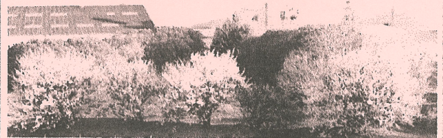
三井精機の梅 越辺川堤防から撮影 2022/02/28