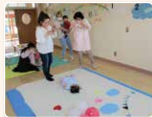
↑「にこにこアート」昨年の様子