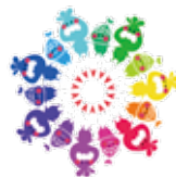
▲ひろばのシンボルマーク

校庭や体育館で遊んだり、音楽室で楽器演奏もできます。勉強したり、本を読んだりすることもできます。ぜひお越しください。※5月4日(土)はお休みです。