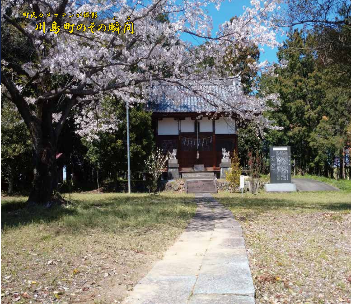
「氷川神社の桜」 撮影場所：三保谷宿氷川神社 2024.4.10 午後1時30分頃

町民カメラマンは、町の催しや景色などを写真撮影し、町の紹介やPRをするボランティアの皆さんです。 現在13人が活動し、毎月、魅力ある「川島町のその瞬間」を紹介しています。