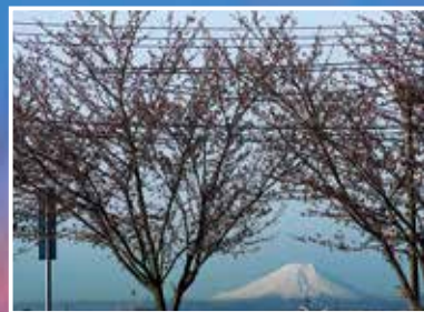
▲安藤川沿いの桜と富士山