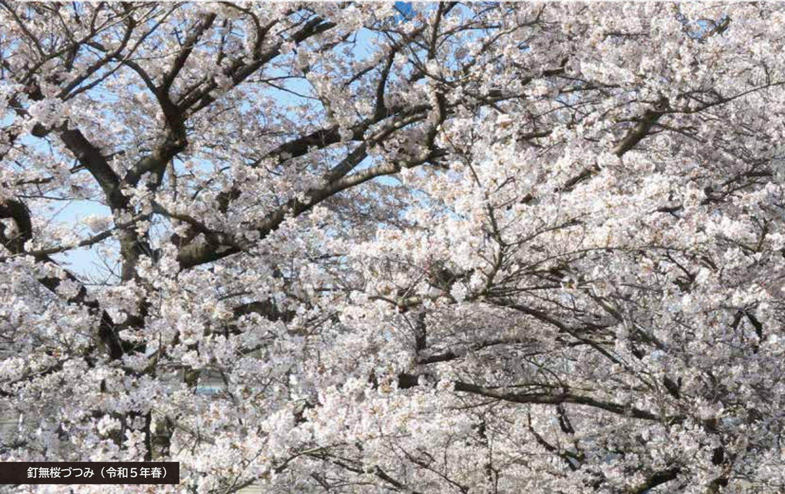
釘無桜づつみ（令和5年春）

農業分野では、ロボット技術など先端技術の活用や、販路拡大を目指す、「輝け！農業イノベーション応援事業」により、新規就農者・認定農業者を支援します。また、鳥獣被害防止のため、アライグマ