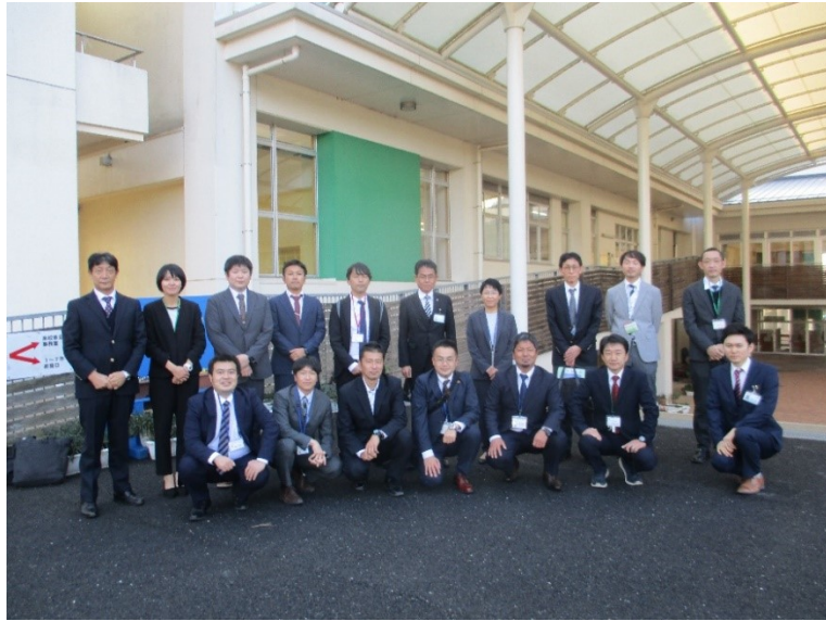
集合写真（校地内・交流広場にて）