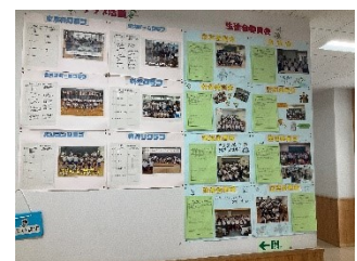
【下総みどり学園 児童会活動写真】

本町でも、下総みどり学園のような小中一貫教育を行うことができると思う。小中一貫だからこそ、可能となる人間性の育成や人間関係の育成を積極的に図っていくべきだと考える。様々な小中一貫教育の取組を行うことができるが、今回視察の中で取り組んでいた【5年生～9年生の児童会活動】は魅力的だと感じた。