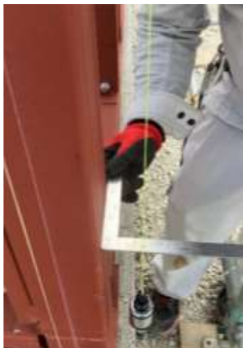
・柱の垂直精度確認