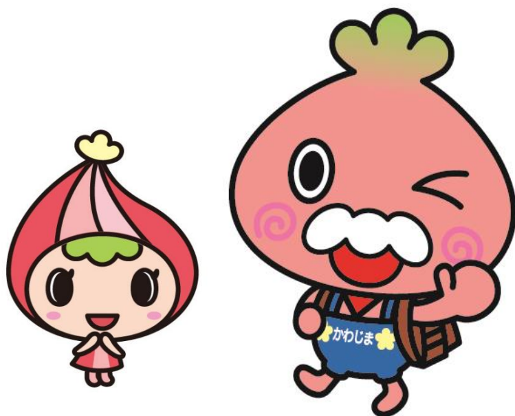
川島町マスコットキャラクター 「かわみん」&「かわべえ」