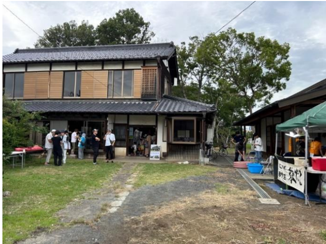
伊草小学校5年 児童焼き芋体験