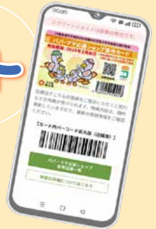
優待カード提示画面 (※画面イメージ)