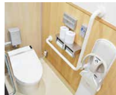
▲子育てに配慮した個室トイレ

誰もが親しめるように、パステルカラーと木目調を組み合わせ、明るく優しいイメージに仕上げられています。全ての個室にはベビーシート、手すりも設置され、女性用トイレには男児用の小便器、女性用だけでなく男性用トイレにもおむつ替えシートを設置することで、子育て世代にうれしいトイレになっています。