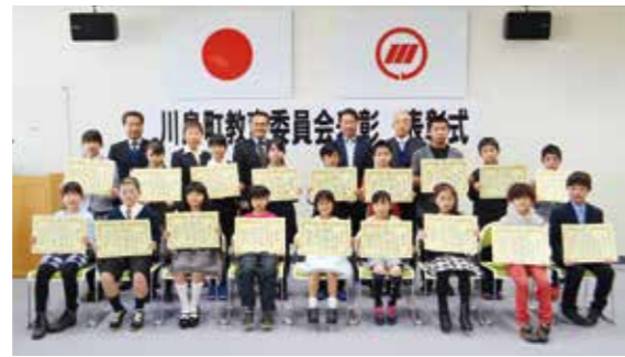
<受賞された小学生>