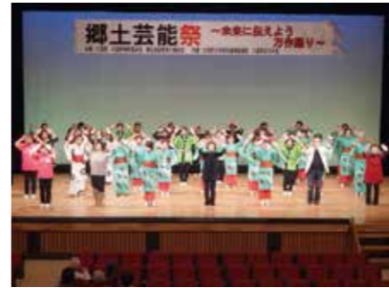
▲みんなで踊る東京五輪音頭 2020

4月13日（土）、町民会館で第32回郷土芸能祭を開催しました。今回は「未来へ伝える」をテーマに、三保谷豊年踊りをつばさ南小学校の児童が大人と一緒に踊りました。また、東京五輪音頭2020を来場者も一緒に踊り、大いに盛り上がりました。