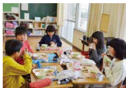
▲おいしそうに給食を食べる児童

4月10日(水)、つばさ南小学校に行ったところ、子どもたちは、おいしそうにお蔵米を食べていました。