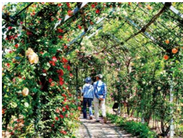
平成30年度優秀賞作品