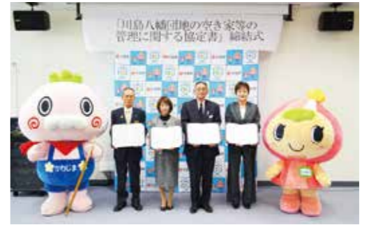
▲協定書締結式にて記念撮影

この協定は、放置された空き家を減少させるため、公社が八幡団地の空き家に対して除草や樹木の剪定費用の一部を助成し、適性な空き家管理の支援を協働して取り組むことを目的としております。