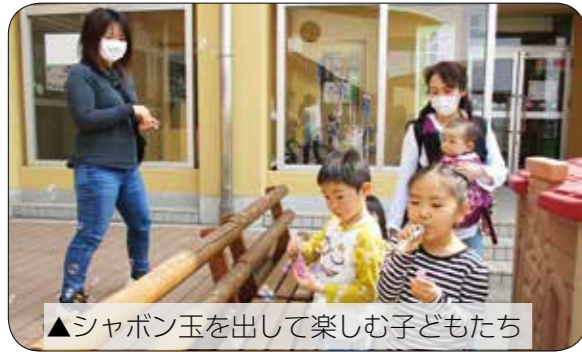
▲シャボン玉を出して楽しむ子どもたち