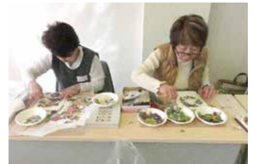
▲押し花教室の様子

しおりやアロマキャンドルを押し花で飾り、自分だけの小物を作り、最後には立派な押し花絵の作品が完成しました。参加者は、和気あいあいと、それぞれが作った押し花を交換し合うなど交流を深め、押し花の美しさと奥深さに感動していました。