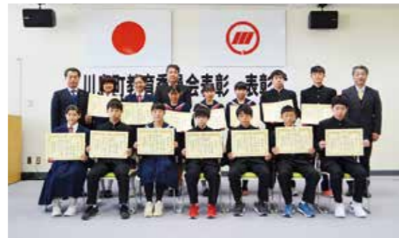
<受賞された中学生>