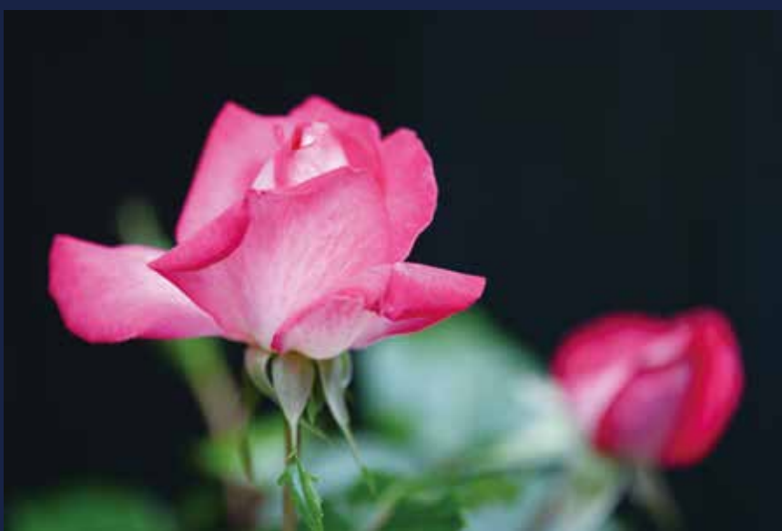
2020.5.6 AM「薔薇の開花状況」 撮影場所：平成の森公園

町民カメラマンは町の紹介やPRのため、町の催しや景色などを写真撮影するボランティアです。現在15の方が活動しています。町民カメラマンがとらえた魅力ある川島町のその瞬間を紹介します。