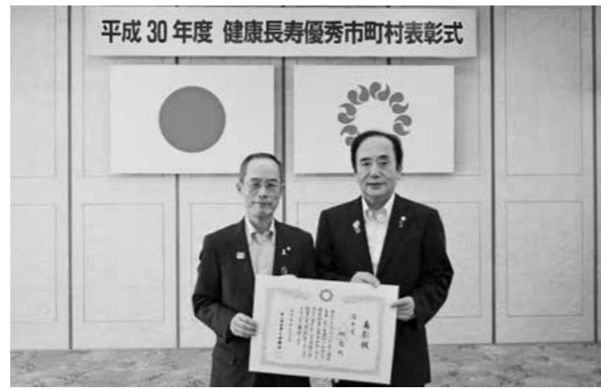
飯島町長と上田知事

7月17日（火）に埼玉県知事公館で、健康長寿優秀市町村表彰式が行われ、町は優秀賞を受賞しました。今回で3回目の表彰となります。多くの町民の皆さんの健康に対する関心が高まったことや、町が実施している健康事業に町民の皆さんが積極的に参加していただいたことが受賞につながりました。