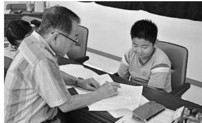
ボランティアの方からアドバイスを受ける様子

7月24日（火）～27日（金）、31日（火）の5日間、町立図書館で「夏休み自由研究・宿題サポート」を開催しました。ボランティアによる丁寧なアドバイスを受けながら、子どもたちは熱心に宿題に取り組んでいました。