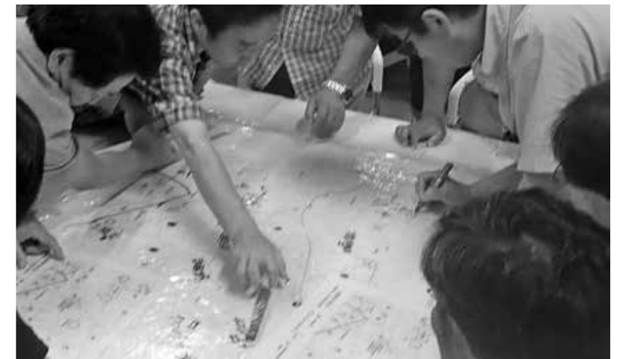
災害図上訓練DIGを行う様子

7月8日（日）に役場で、町内の自主防災組織を対象とした「川島町自主防災組織リーダー養成講座」を開催しました。県が任命する自主防災組織リーダー養成指導員10人が講師となり、「イツモ防災講座」、「災害図上訓練DIG (Disaster Imagination Game)」を行い、62人の参加者が平常時の災害対策が重要であることを確認し、実際の地域災害発生を想定した対応を検討しました。