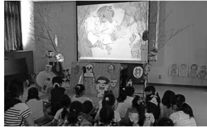
スライド上映によるこわいおはなし

7月22日（日）に町立図書館で「こわ～いおはなし会」を開催しました。読み聞かせボランティア「おはなしたまてばこ」の皆さんによる、こわいおはなしの語りやスライド、大型紙芝居などがあり、子どもも大人も楽しんでいました。