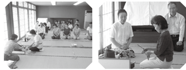
▲緊張しながらも熱心に

小見野公民館は、5月～7月の毎週水曜日に、全10回にわたり茶道教室を開催しました。この教室は、30年以上前から開催されている人気の講座です。今年も、15人の定員を上回る17の方が参加しました。