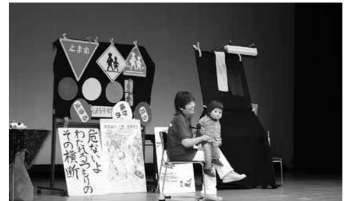
腹話術を交えた交通安全スクール

7月16日（祝・月）に町民会館ホールで、親子交通安全教室を開催しました。当日は、交通指導員への感謝作文の朗読や、田園戦士かわじまんショー、交通安全まなび隊（埼玉県ボランティア）による交通安全スクールを行いました。