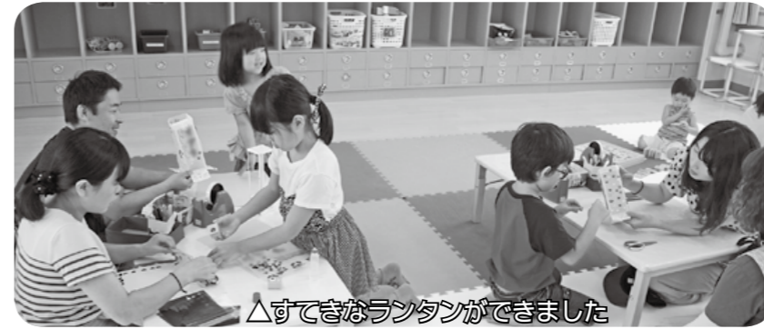
△すでにランタンができました