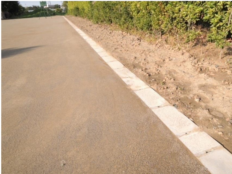
○U字溝・コンクリート蓋