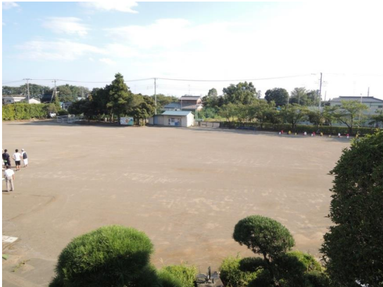
○三保谷小学校グラウンド全景