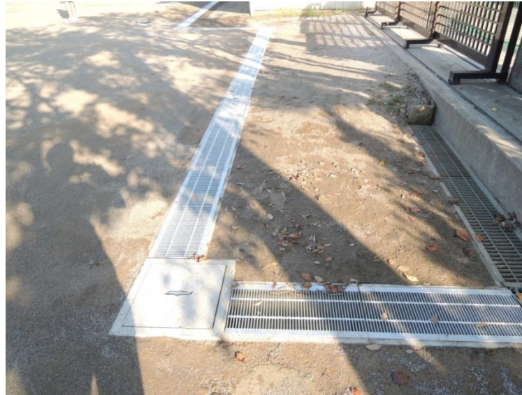
○U字溝・グレーチング蓋、集水枡