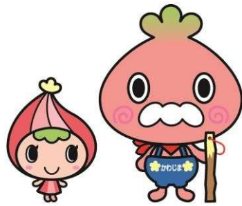
川島町マスコットキャラクター かわみん・かわべえ