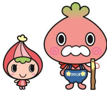
川島町マスコットキャラクター かわみん・かわべえ