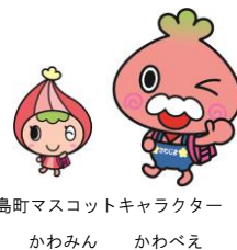
川島町マスコットキャラクター

平成30年4月から、三保谷小学校の位置に(仮称)三保谷・出丸小学校、八ッ保小学校の位置に(仮称)八ッ保・小見野小学校が新しく開校し、川島中学校と連携、交流し、小中一貫教育を進めます。そこで、川島町小学校統合協議会では、この新しい2校にふさわしい校名案を募集します。