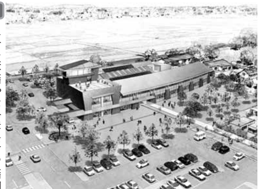
新庁舎イメージ図

問 主に鉄橋や高速道路の橋脚に使用するプレストレス鉄筋コンクリートを11・6mのスパンの庁舎に使う理由は。