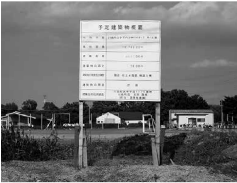
庁舎建築物の看板が建設予定地に設置