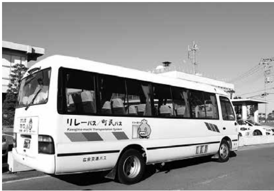
試行運転中の町民・リレーバス

問 雪害による農業ハウスの再建にあたり具体的な再建の見通しは。 答 新聞等でも人手不足や資材不足に関して報道されており、農家の方からも工事の注文が殺到していると同っています。埼玉県からの情報によると、パイプハウスの場合、通常1か月で完成するところが早くても3か月程度、鉄骨ハウスの場合4、5か月程度かかる状況です。町だけで対応できる問題ではないことから、県や農協にも