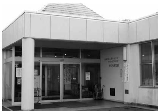
改修工を行うやすらぎの郷

答 集会室は、床の張り替え・照明のLED化・エアコンの交換となります。教養娯楽室・会議室はフローリングに、中央の仕切りを可動式スライディング戸として一体利用できるようにします。トイレはウォシュレット型に、浴室のボイラーは災害に強い発電機を備えたガスに変更します。デイサービスルームを増築して、定員が25名から45名となります。