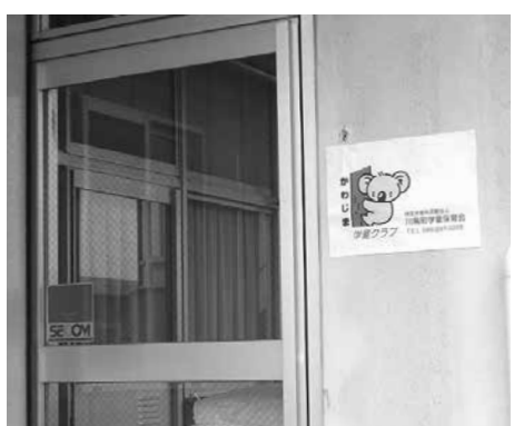
3年目となる川島学童クラブ

問 南三陸の森の間伐材で作った書き損じハガキポスの設置は。 答 町主体ではなく、団体等が主体となり公共施設に設置するということは可能だと考えます。 問 急速な高齢者社会に対応できる新しい通報システムについて。 答 導入している町の状況を把握し研究していきます。 問 大災害に備え避難場所が仮設診療所になりえます。町の避難所に医療救護用品の備蓄は。 答 指定避難所には応急手当用の包帯、消毒液等が入った救急箱を設置しています。介助が必要な高齢者や傷病者は重症度に応じて福祉避難所へ搬送することとしております。医薬品は施設が保管するランニング備蓄を使用します。可搬式医療器具の配備は今後研究してまいります。