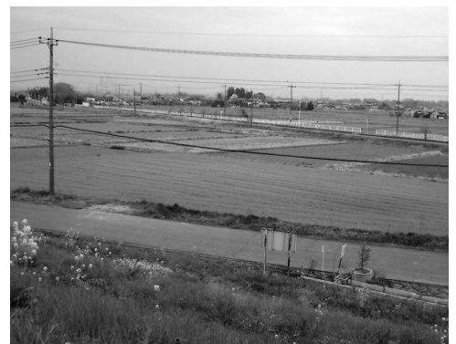
将来の開発が待たれる長楽耕地

問 おります。 町長 副町長時代にも、折に触れて県土整備事務所に整備促進のお願いをしてまいりましたが、今後もさらに積極的にお願いをしてまいります。