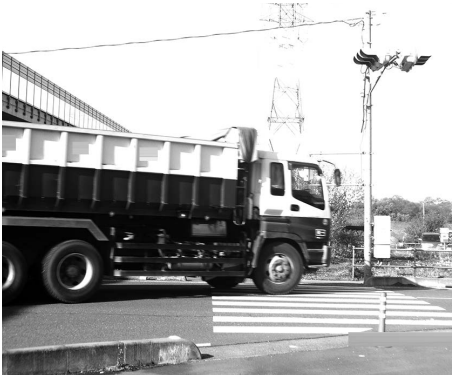
歩行者信号機の早期設置を

問 新庁舎に伴い住民へのサービス向上を目的として複数課にまたがる各種申請、交付、証明業務を一つの窓口で行えるワンストップ総合窓口の設置について町の考えは 答 政策推進課長 新庁舎への移行は住民サービスを向上させる好機です。来庁した住民の方を移動させず担当部署の職員が入れ替わることで対応するワンストップ総合窓口方式導入を検討しています。