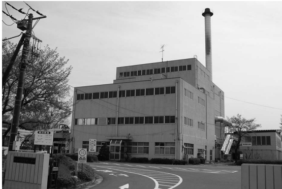
川島町環境センター

答 町では、全体の保険給付費の伸びが、平成23年度までは7%程度ありましたが平成24以降1%と少なくなっています。特定健康診査の受診率が上がっており、その効果が出ていると思います。