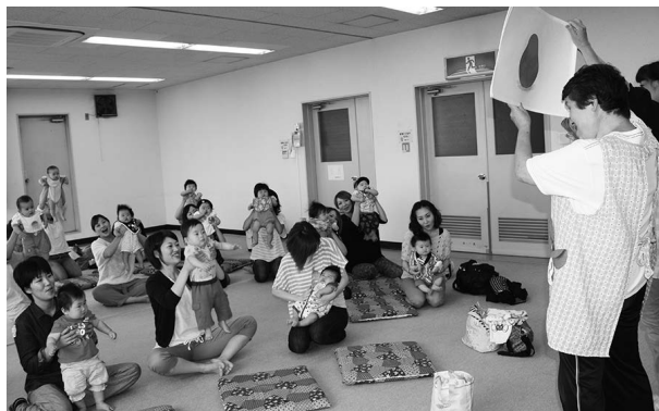
子ども子育て支援事業

問 家具の転倒防止対策として、7千世帯に金具の補助をするとのことですが、内容は。