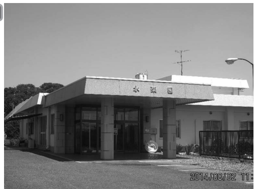
特別養護老人ホーム 永楽園

問 平成25年に起きた事件で町は永楽園施設長を告発しました。間違いありませんか。 答 町長 暴行行為により、職務を妨害されたため、警察に刑事告発しました。 問 暴行行為の内容、回数、場所痛み、診断書などについて伺います。 答 町長 議場は公判の場所ではないので、答弁は差し控えます。 問 東松山警察署、さいたま地方検察庁川越支部からの事情聴取は受けていますか。 答 町長 双方からの事情聴取は受けています。