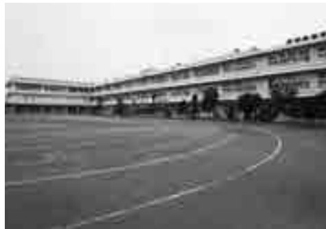
整備が待たれる中山小学校の校庭

答 戸守地区の西の東松山地区に、大型商業施設、また407号線のバイパスも整備が進み、非常に交通アクセスも良好な事は、承知しております。現在町は、インターチェンジ南側開発を最重要政策として進めており、これからも、積極的な企業誘致は、重要であると考えております。自主財源を確保の為、法人税や固定資産税の増加、また雇用の創出となる働く場所の確保が図れるよう取り組んで参ります。