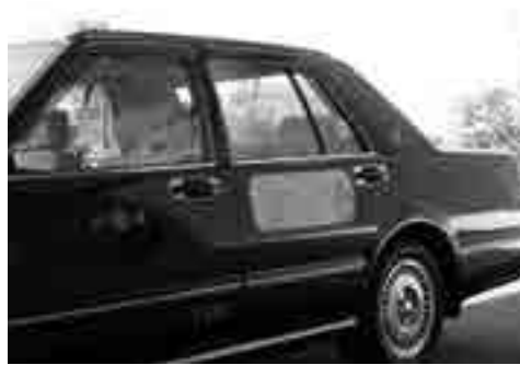
好評のかわみんタクシー

ていただきたい。今後も拡充については、皆様の意見を踏まえ、また財政負担も考え、地域公共交通会議で検討して参ります。 問 タウンプロモーションは、ホームページでの閲覧回数は上昇し良好だが、他市等へ出向いの魅力発信の今後は。 答 継続して行くことで効果が現れるものと思っております。今後も、町外・県外のイベント等に積極的に参加して、まちのPRに取り組んで参ります。