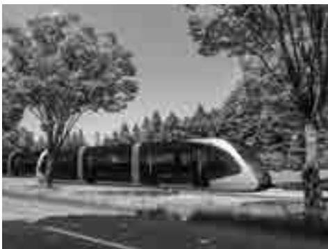
宇都宮市と芳賀町をつなぐLRT

答 国管理区間の河川敷の樹木管理は荒川上流事務所が河川巡視などで状況を把握、流下障害となっていると判断した時は、調査対象としています。町としても状況が確認され次第、国への情報提供、対応調整をします。 問 町は、現状が問題ないと考えているのか。 答 適切な管理を国に働きかける。