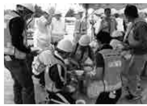
訓練により防災意識の向上を

問 避難所開設、運営の訓練は。防災訓練の中で避難所開設訓練を行っております。今後はHUG訓練の実施を検討します。HUG訓練とは。