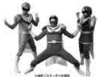
町民ぐるみでごみ減量化を