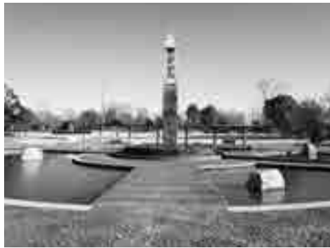
一大リニューアルに

答 平成の森公園の位置づけを一からよく考えて、周辺の土地利用、また交通アクセスも見直した中で検討します。 問 川島町土地改良区と町は、消防水利として防災協定の考えは。 答 自然水利は有効な資源です。今後川島町土地改良区と協議します。 問 合同就職面接会の結果は。 答 町内事業者16社が参加し、求職者55名で、23名採用になりました。今後も雇用の場の創出に努めます。