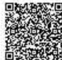
(ハザードマップのQRコード)

本町は周囲を河川に囲まれており、堤防が決壊したときは、町の大部分が浸水し、大きな被害を生じることが予想されています。そのため、水害に対する予防は特に重要であるとされており、少しずつ着実に進めていくことが必要です。