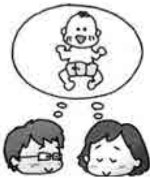
風疹予防ワクチン接種

答 妊婦が風疹に感染すると先天性風疹症候群のお子さんが産まれるリスクが高くなるため、11月26日より、風疹予防ワクチン接種助成事業を開始しました。助成額は、1回一人3000円です。