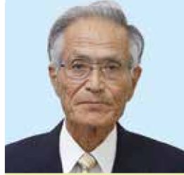
さいど よしのり 道祖土 美登 中山地区全域