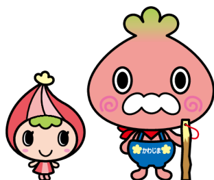
川島町マスコットキャラクター 「かわみん」 「かわべえ」