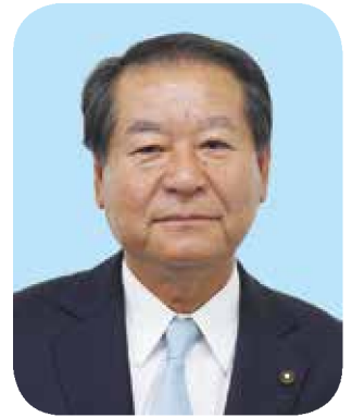
川島町農業委員会