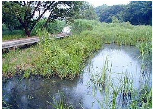
〈三ツ又沼ビオトープ〉