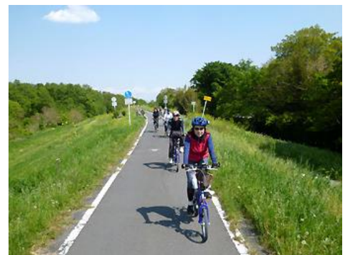
〈荒川自転車道でサイクリング〉