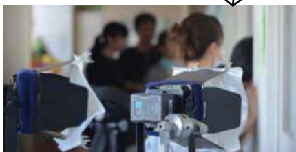
〈ドラマ・CM等ロケ実績〉