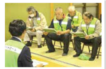
県職員による 防犯のまちづくり出前講座

最近では、屋根修理などを装った悪質な業者が増えています。そんな時、一人で判断せずに、『変な業者が来てるよ』と情報共有できる関係が地域にあれば、被害は防げます。 自治会に加入していない人たちも、私たちが楽しそうに活動している姿を見て、「ああいう人たちがいるから地域が綺麗で安全なんだ」と思ってくれるはずです。そうした理解が進めば、人は自然に集まります。「この地域にはこういう人たちがいる」と互いに知ることが、最大の防犯であり防災です。