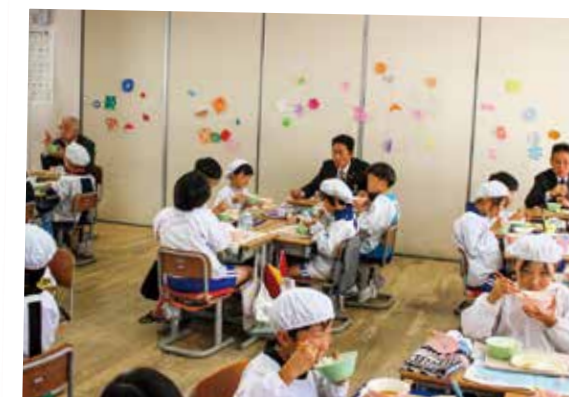
▲ 伊草小学校での様子