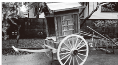
1 ざかん 座棺を運ぶ棺車