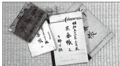
3 とこばんちょう 床番帳