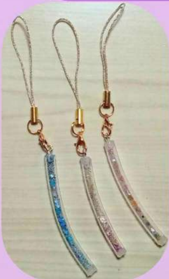
キラキラチャーム